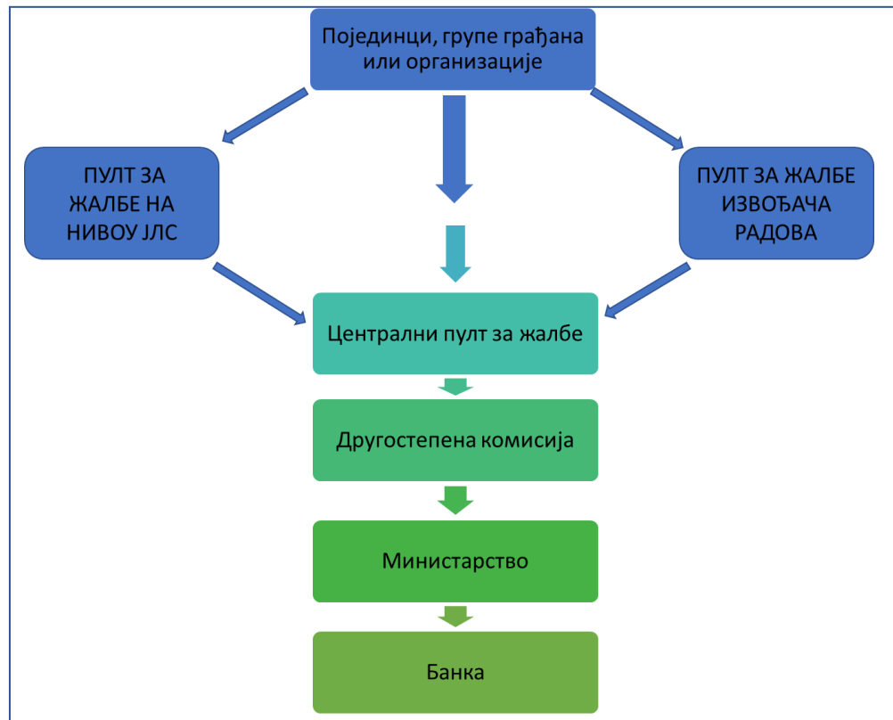
Слика 1. Шема функционисања жалбеног механизма

доноси Другостепена комисија образована решењем министра грађевинарства, саобраћаја и инфраструктуре. Организација ЖМ-а је представљена на слици 1 овог документа.