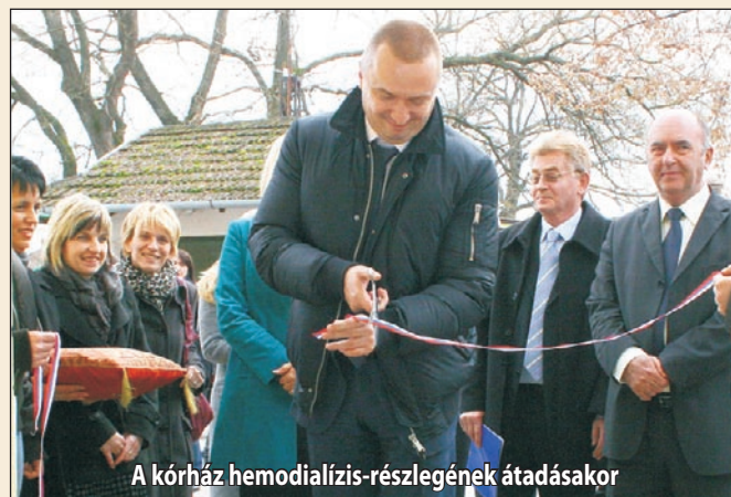
A kórház hemodialízis-részlegének átadásakor

Új padlóburkolatot kapott a kevi iskola. A többéves törekvések megvalósulásaként hivatalosan is szétváltak egymástól az egészségi intézmények, a kórház, az egészségház és a gyógyszertár. Három dél-szerbiai község, Bujanovac, Medveda és Preševo küldöttsége látogatott Zentára. Az önkormányzat rendkívül színvonalas ünnepi hangversennyel lepte meg a polgárokat, fellépett Kinka Rita, a Művészeti Akadémia szimfonikus zenekara és a Vajdasági Vegyes Kórus. Bojan Pajtić tartományi kormányfő ünnepélyesen átadta rendeltetésének a zentai kórház újonnan kialakított hemodialízis-részlegét. A projektum öszszértéke kb. ötmillió dinárt tesz ki. Nemzetközi irodalmi fesztivált szervezett a zEtna. Az önkormányzatot a magyar konzulátussal annak érdekében, hogy tájékoztassák a lakosságot a kettős állampolgár-