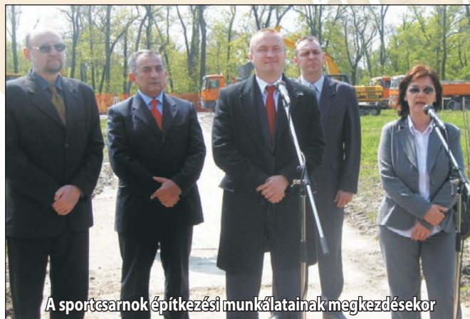
A sportcsarnok építkezési munkálatainak megkezdésekor

A községi képviselő-testület döntést hozott a szórakozóhelyek nyitvatartási idejéről szóló rendelet módosításáról azért, hogy azok hétvégenként hajnal három óráig lehessenek nyitva. A zentai és az adai képviselő-testületek elnökei, Rác Szabó László és Csonka Áron kezdeményezték, hogy az érvényben lévő KI jelzés helyett a jövőben két község közösen használhasson saját gépjármű-regisztrációs jelzést. Bojan Pajić tartományi kormányfő jelenlétében hivatalosan is megkezdődött a zentai sportcsarnok építésének első szakasza. Az