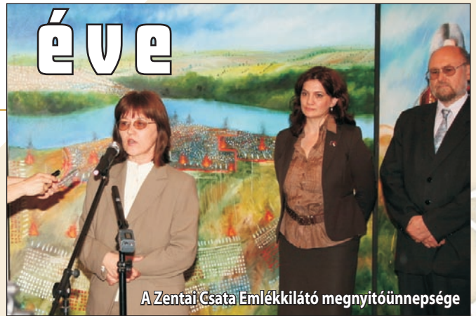
A Zentai Csata Emlékkilató megnyitóünnepsége