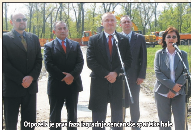
Otpočela je prva faza izgradnje senčanske sportske hale

Skupština opštine je donela odluku o izmenama uredbe o radnom vremenu ugostiteljskih objekata, kako bi isti tokom vikenda mogli biti otvoreni do tri časa posle ponoći. Predsednici skupština Sente i Ade, Laslo Rac Sabo i Aron Čonka, pokrenuli su inicijativu da umesto važeće registarske oznake „KI“ dve opštine ubuduće zajednički koriste sopstvenu registarsku oznaku. U prisustvu pokrajinskog premijera Bojana Pajtića i zvanično je otpočela prva faza izgradnje senčanske sportske hale. Objekat će prema planovima