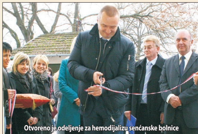
Otvoreno je odeljenje za hemodijalizu senčanske bolnice

Škola u Keviju je dobila novu podnu oblogu. Kao ostvarenje višegodišnjih nastojanja došlo je i do zvaničnog razdvajanja zdravstvenih ustanova – bolnice, doma zdravlja i apoteke. Sentu su posetile delegacije triju opština iz južne Srbije, Bujanovca, Medvede i Preševa. Pokrajinski premijer Bojan Pajić je u svečanoj atmosferi predao na upotrebu iznova uspostavljeno odeljenje za hemodijalizu senčanske bolnice. Ukupna vrednost projekta iznosi oko pet miliona dinara. Elektronski časopis zEtna je organizovao međunarodni literarni festival. Nadležni u lokalnoj samoupravi su uspostavili kontakt sa mađarskim konzulatom zarad informisanja stanovištva o relevantnim pitanjima u vezi dvojnog državljanstva. Impozantno uspešnom dobrot-