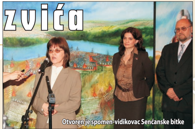
Otvoren je spomen-vidikovac Senčanske bitke