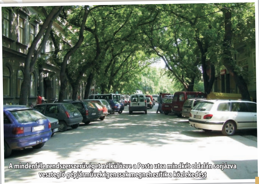
A mindenféle rendszerszerűség nélkülvözve a Posta utca mindkét oldalán sorjázva veszteglő gépjárművektigancsak megnehezítik a közlekedést

A munka eredményeként az illetékes szervek megkapják a terveket, ami alapján ki lehet majd jelölni a parkolásra alkalmas helyeket. Ezen tervek kidolgozásának a parkolóhelyek kijelölése mellett a másik fő célja a közlekedés műszaki szabályozása. A tervek megszületését