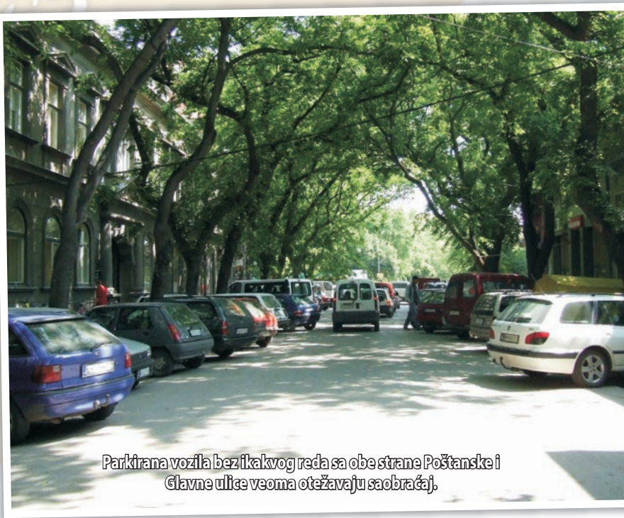
Parkirana vozila bez ikakvog reda sa obe strane Poštanske i Glavne ulice veoma otežavaju saobraćaj.

Kao rezultat toga, nadležni organi će dobiti plan na osnovu kojeg će biti moguće utvrđivanje mesta podesebnih za parkiranje. Pored određivanja mesta za parkiranje, drugi glavni cilj izrade ovih planova predstavlja tehnička regulacija saobraćaja. Izrada plana opravdavana je i nastojanjem za povećanjem bezbednosti saobraćaja i ispunjavanjem zakonskih obaveza.