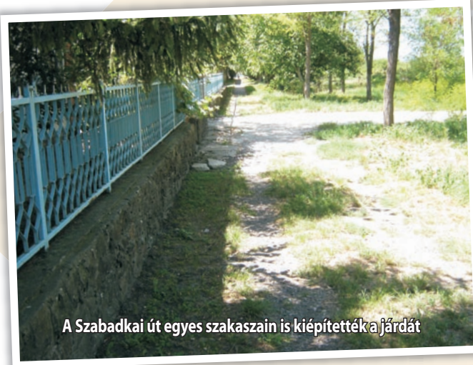
A Szabadkai út egyes szakaszain is kiépítették a járdát