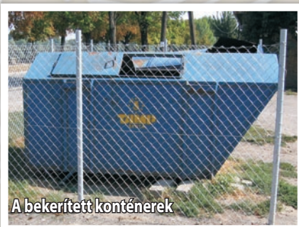
A bekerített konténer