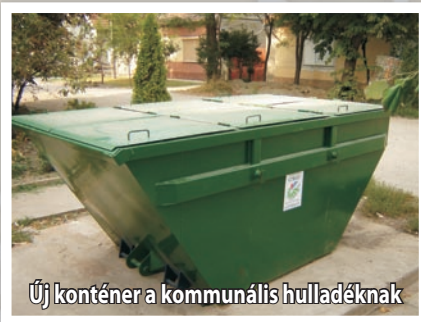
Új konténer a kommunális hulladéknak