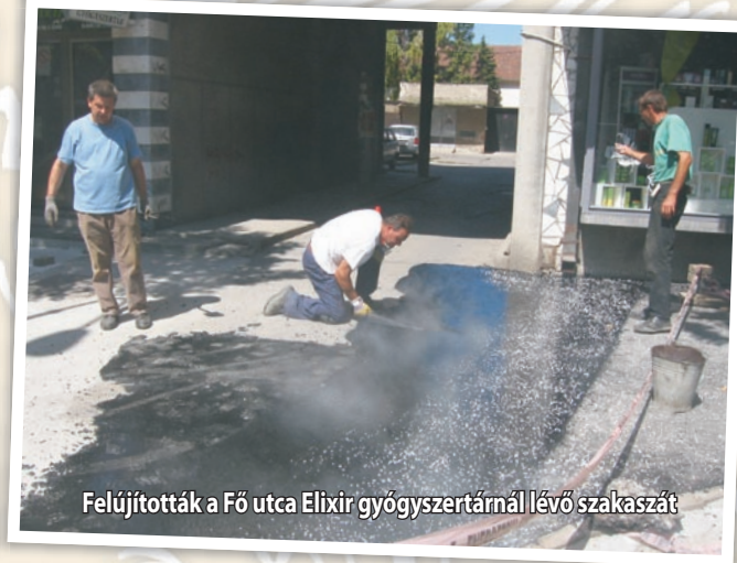
Felújították a Fő utca Elixir gyógyszertárnál lévő szakaszát