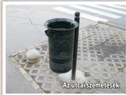
Az utcai szemetesek