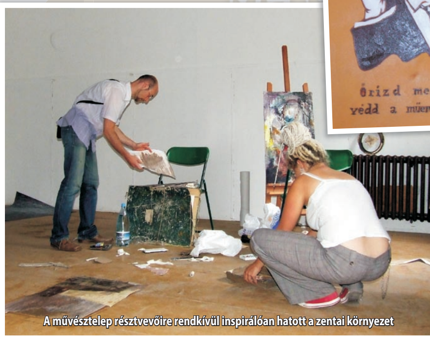
A művésztelep résztvevőire rendkívül inspirálón hatott a zentai környezet

A Pécsi Tudományegyetem Művészeti Karának munkatársai azt szeretnék, ha a zentai művésztelep hagyományossá válhatna, és a fiatal művészek évről évre visszatérhetnének Zentára. Abban bíznak, senki nem vette rossz néven, hogy megpróbálták a művészet nyelvén fel-