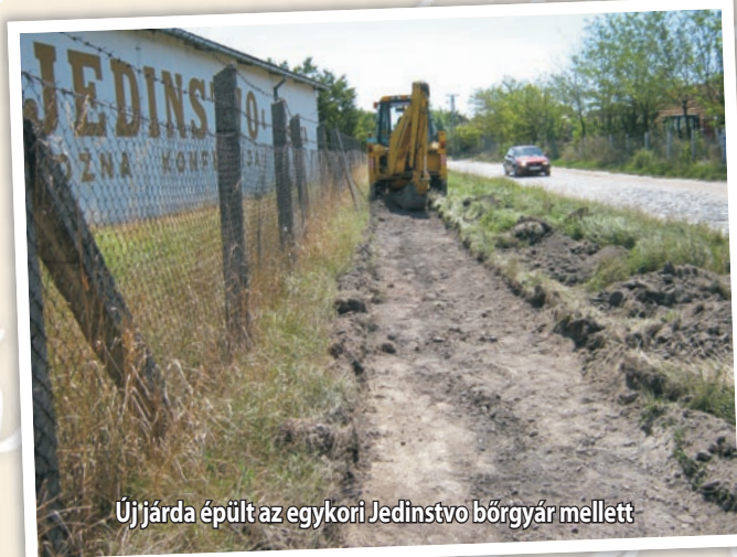
Új járda épült az egykori Jedinstvo börgyár mellett

A járdafelújítási munkálatok sokak örömeire érintették a Fő utca Elixir gyógyszertárnál lévő szakaszát, az Árpád utcának a Csóka felé vezető hídtól csaknem a Svetozar Miletić utcával való kereszteződéséig terjedő szakaszát, a Tornyosi út páratlan oldalának a vasúttól a Gaj utcával való kereszteződésben található jelzőlámpáig terjedő szakaszát, illetve a Posta utca, a Jovan Đorđević utca és a Boško Jugović utca egy-egy szakaszát is. Ezenkívül teljesen új járda épült az egykori Jedinstvo börgyár mellett található Horti István utcának a Petőfi brigád és a Szabadkai út közötti szakaszán, amelyen a gépjárművekkel közlekedők korábban csak terméskővel borított utat használhattak, a gyalogosok és a kerékpárosok pedig csak egy kitaposott ösvényen közlekedhettek. Mindemellett a Szabadkai út azon szakaszán is kiépítették a gyalogosok számára a járdát, ahol korábban egyáltalán nem volt olyan út, amely alkalmas lett volna a gyalogosforgalom lebonyolítására. A városvezetés illetékesei abban bíznak, hogy ezen munkálatok által jelentős mértékben hozzájárultak ahhoz, hogy városunk polgárai még jobban érezzék magukat Zentán.