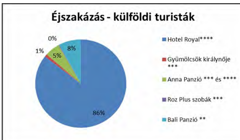
1. grafikon: A hazai és külföldi turisták érkezésének szálláshelyek szerinti megoszlása 2014-ben

Az 1. számú grafikonból látszik, hogy a hazai turisták legnagyobb számban (76 %) a Royal Hotel és a Bali Panzió (15 %) szálláskapacitásait használta. Hasonló a helyzet a külföldi turisták esetében is, 86 %-ékuk a Royal Hotelt választotta.